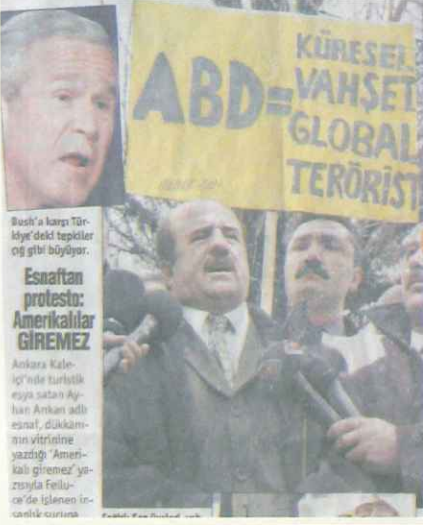
Bush'a karşı Türkiye'deki tepkiler oğ gibi büyüyor. Esnafın protestosu: Amerikalılar GIREMEZ

ABD'nin Irak'taki katliamlarını protesto için başlatılan "Katile cephane olmayalım kampanyası, bütün yurttan yaygınlaşıyor.. KAMPANYAYA DESTEK ÇİĞ GİBİ"