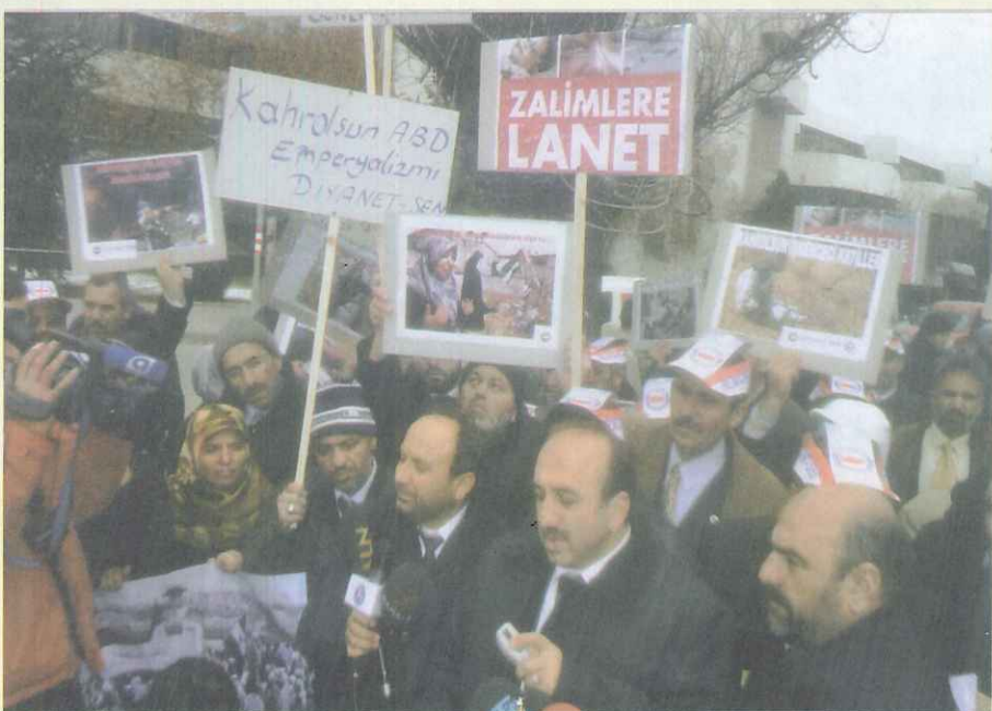
81 ilden gelen Diyanet-Sen Şube ve İl Başkanı, Irak ve Filistin başta olmak üzere dünyada işkence ve katliamların sona ermesi için ABD'nin Ankara Büyükelçiliği önünde bir dua eylemi gerçekleştirdi.

Felluce'de savaş suçları işleyerek bir insanlık dramına sebep olan ABD, Türkiye'nin çoğu şehrinde düzenlenen gösterilerle protesto edildi. Ankara'da ise, Memur-Sen'e bağlı Eğitimciler Birliği Sendikası üyeleri ABD Büyükelçiliği önüne siyah çelenk bıraktı. Sendika Üyeleri, Türk halkına, Amerikan mallarını boykot çağrısı yaptı.